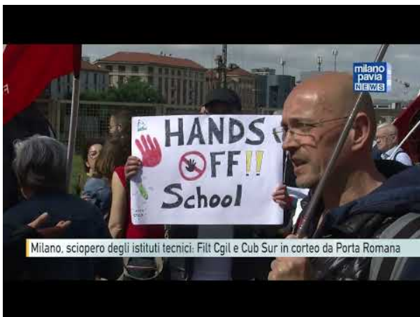
Milano, sciopero degli istituti tecnici: Flc Cgil e Cub Sur in corteo da Porta Romana