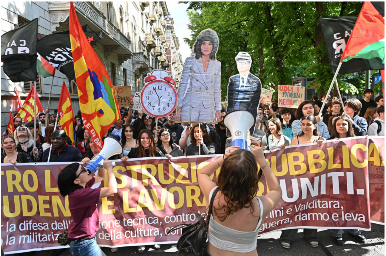
Scuola in sciopero: la riforma di Valditara è «classista»