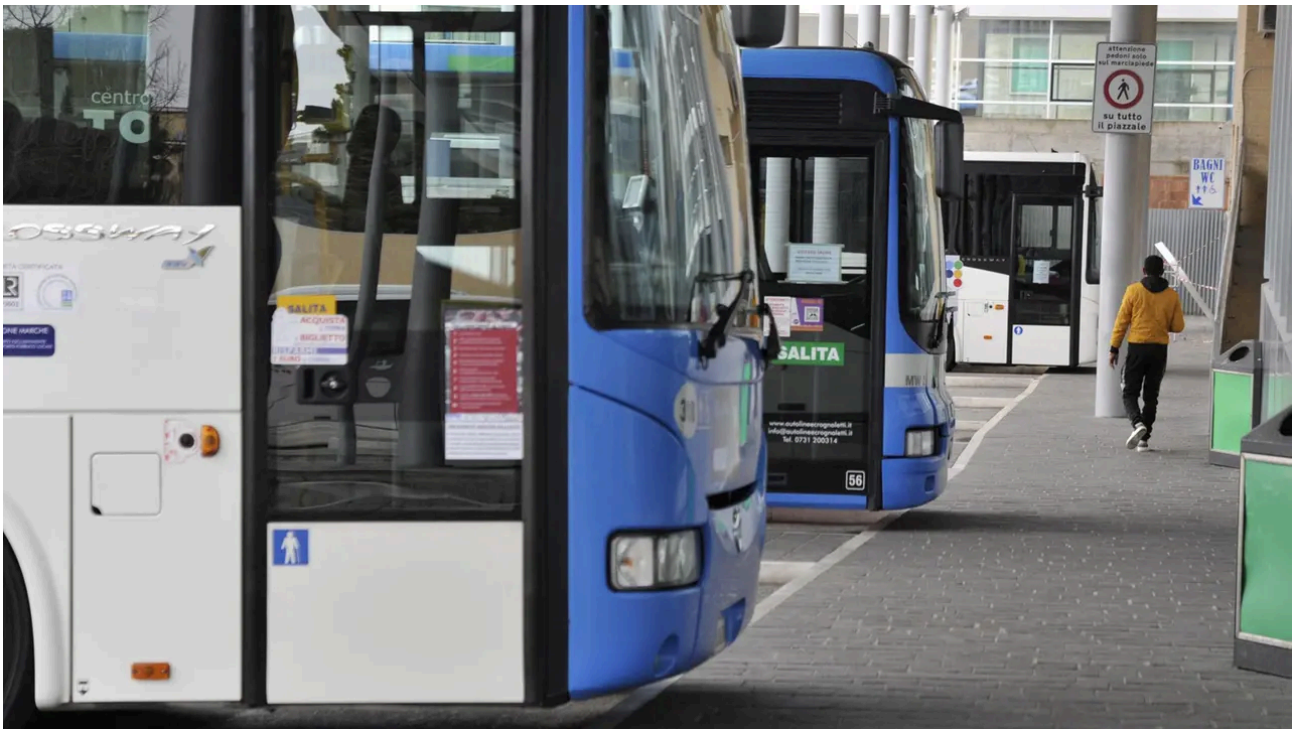
Un terminal dei pullman