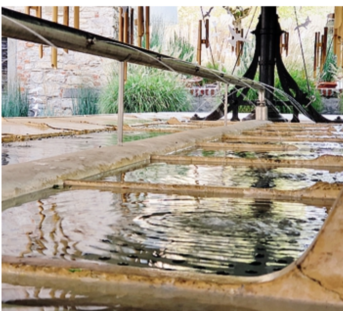
Per Uniacque un piano d'investimenti da 94 milioni di euro tra il 2022 e il 2024, di cui il 38% destinato al rinnovamento di impianti