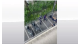
Video choc Milano, si indaga per...