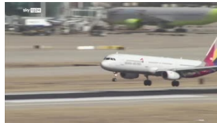
Corea del Sud, potellone aperto in volo