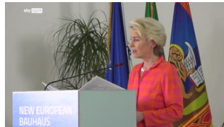
Maltempo, von Der Leyen: dal Pnrr 6...