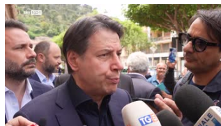
Conte: governo pensi subito a...