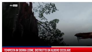
Tempesta in Sierra Leone, distrutto un...