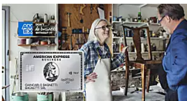
Messaggio pubblicitario con finalità promozionale.

American Express Sei un libero professionista o hai un'attività? Scegli le Carte Business di American Express.